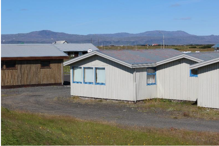
Færanlegar kennslustofur á Eyrarbakka