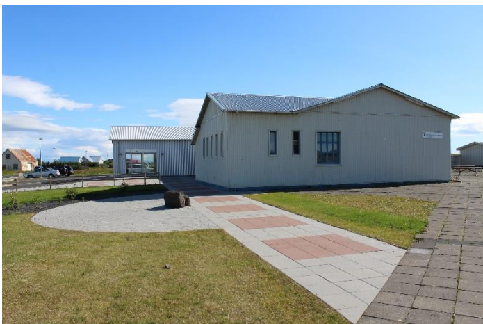
Skólahúsnæði unglingastígs Eyrarbakka