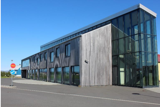
Skólahúsnæðið á Stokkseyri