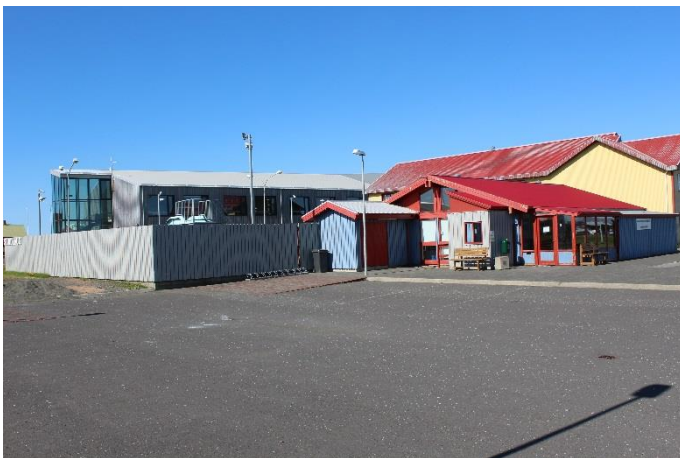
Sundlaugin og gamla skólabyggingin á Stokkseyri