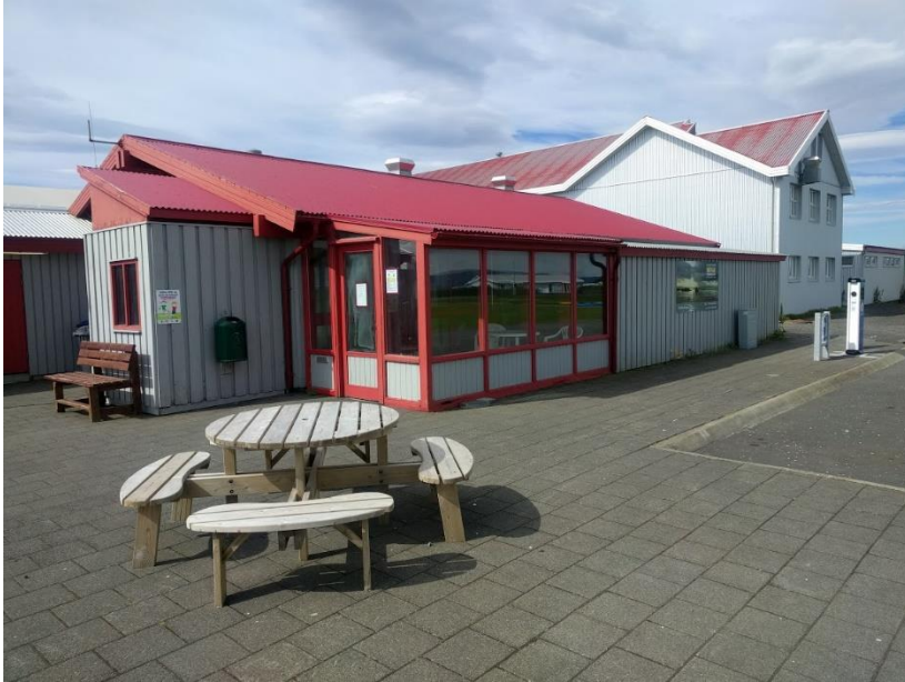
Sundlaugarhúsnæðið á Stokkseyri