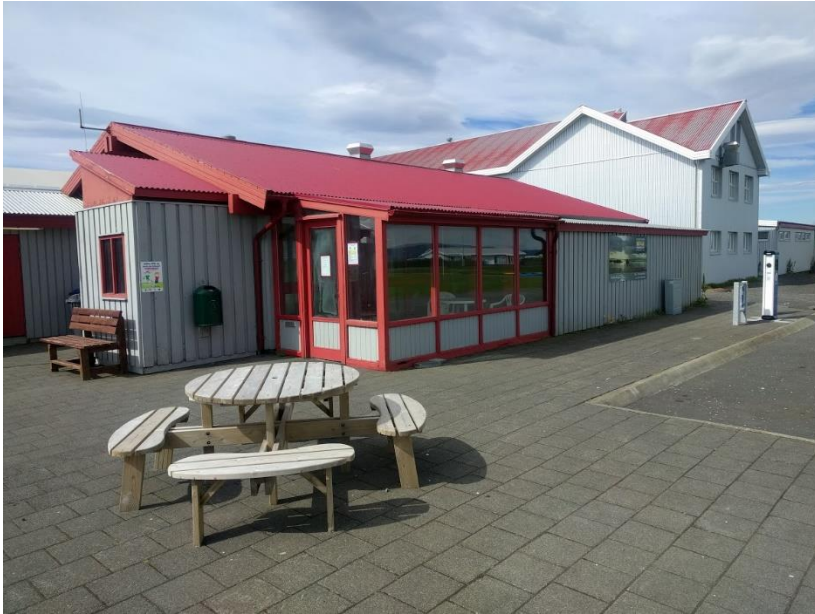
Sundlaugarhúsnæðið á Stokkseyri