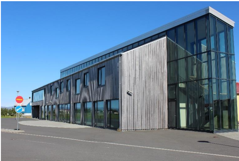
Skólahúsnæðið á Stokkseyri