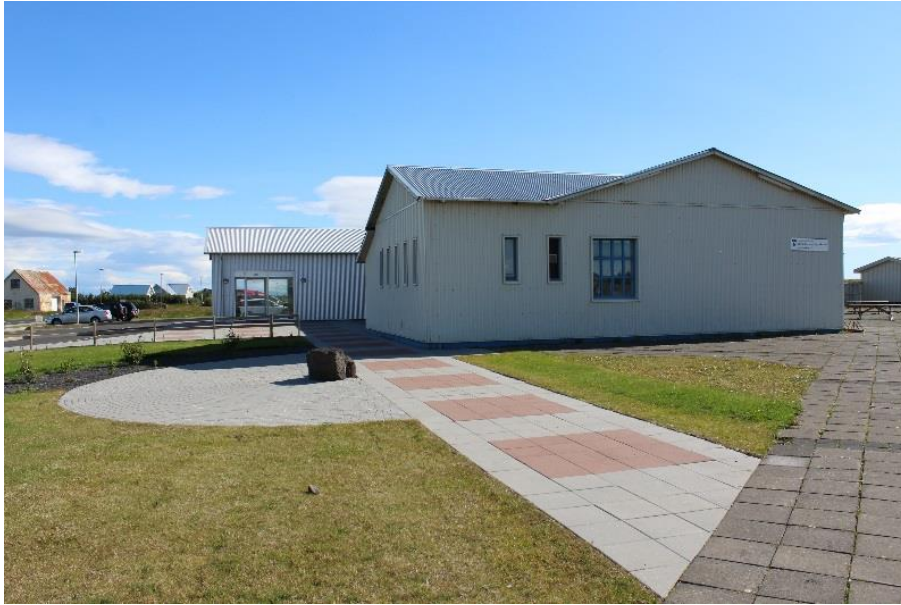
Skólahúsnæði unglíngastígs Eyrbakka