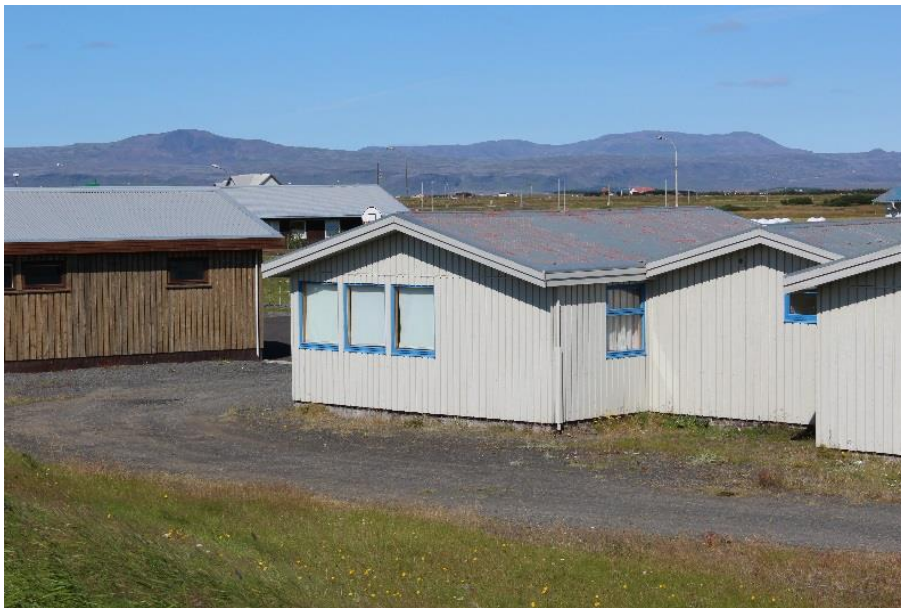
Færanlegar kennslustofur á Eyrbakka